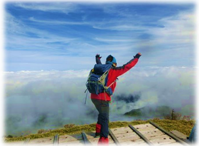
10:50 雲海気持ち良さそう、でも飛び込まないで