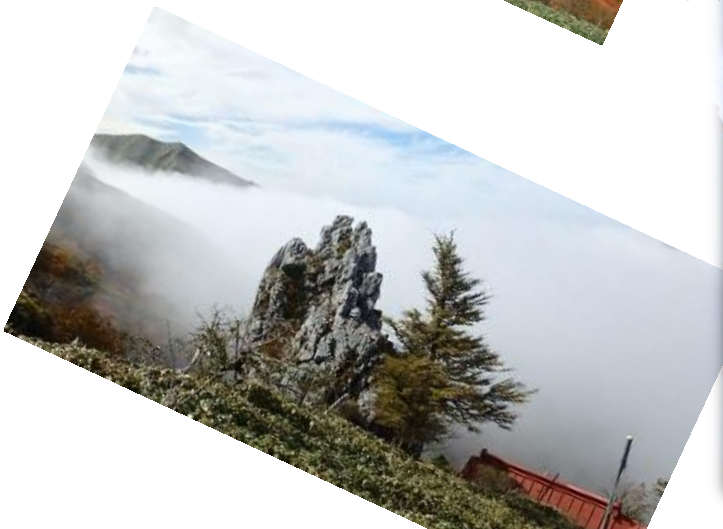
11:05 御塔岩を従え世界最高良縁 太陽背にした大剣神社ご神水も有名