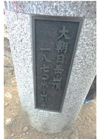
10:51 大朝日岳 1870m