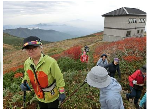
10:32 小屋から出発 すぐにマツムシソウに会う私が初めて覚えた山の花