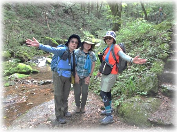
13:03 ステキな場所ガーデンです シャワー浴びた様 びっしょりへアー