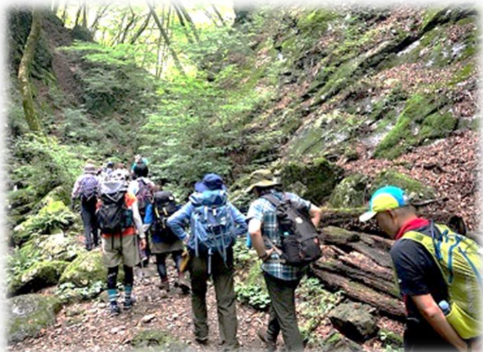
13:55 帰りは平たんな道が多いですから〜と NO4