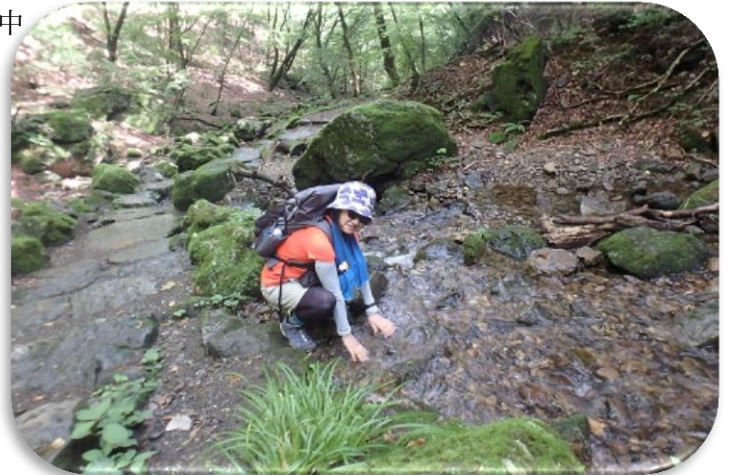
皆さんはーいポーズ！