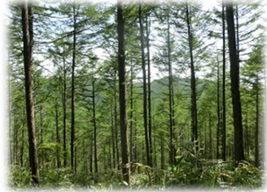
9:02 2/10 かすかに山が