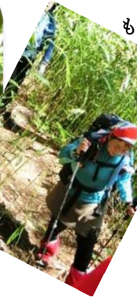
もうすぐ休憩だよ