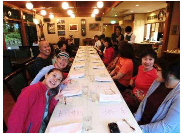
16:40 帰路風呂に入り 18:30 夕食 レストラン、今日のメニュー 飲み物注文中