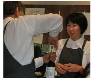
注文赤ワイン ご主人開けて 下さる