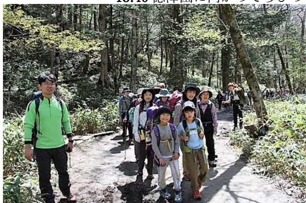
13:40 徳澤園に向かってちびっこ先頭で出発 青空にお山がまぶしい