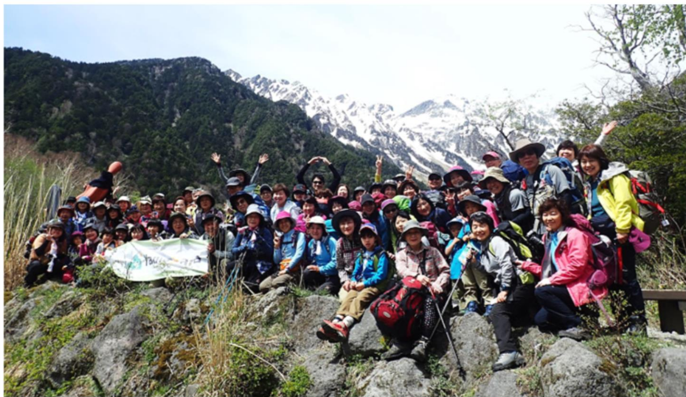
13:30 全員集合写真 去年は正面から撮影今年は斜めからの撮影ちよっぴり失敗！左側誰だかわからない