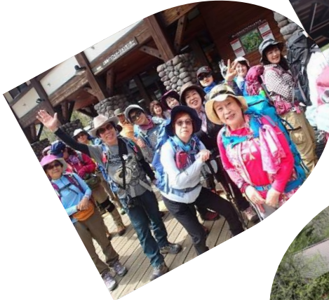
4列に並んでくださ～い 一人いない？名簿確認 13:15 カップ橋まで出発