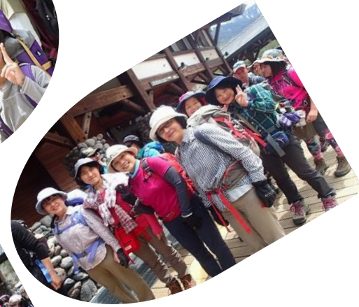
明日のお天気崩れ？ 保険で今日記念写真撮る