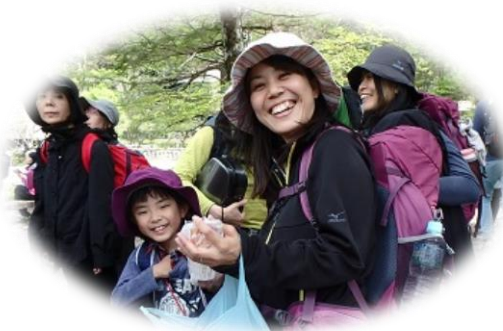
橋渡った所で記念写真