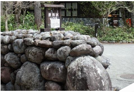
13:10 水飲み場集合 WC 済ませて