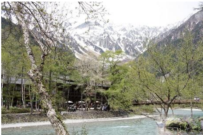
透き通った川面からの緑