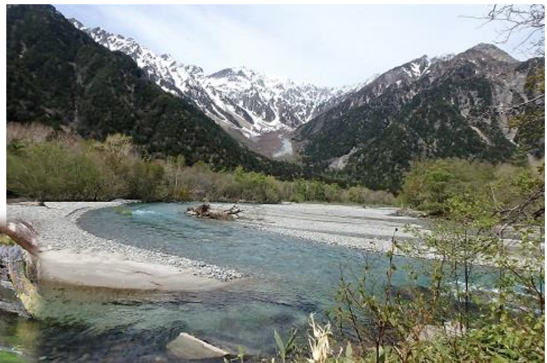
日本一透明度の梓川流されてくる石等川底を 整備して観光客に美しい川を見せてくれている