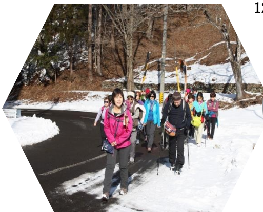
12:21 動物の足跡? 12:36 雪景色 畑だけで無く 山々も 白く輝く