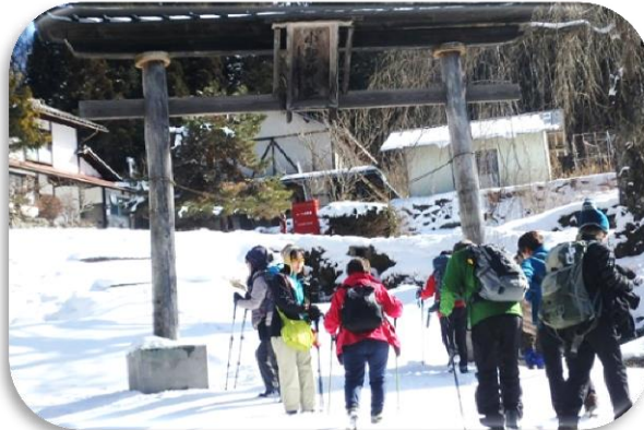
12:13 出発しますよ車に気を付けて