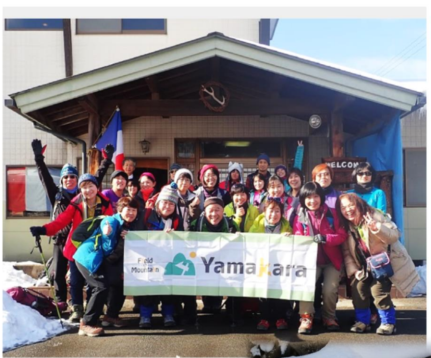
11:50TOMATO で最後の全員集合写真 すぐそばに天宗寺合掌桜見事開花には さぞ綺麗でしょう