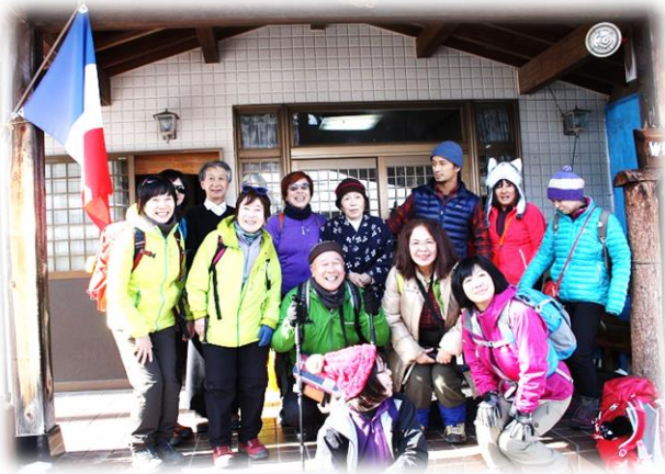
11:45 イケメン息子さん争奪戦