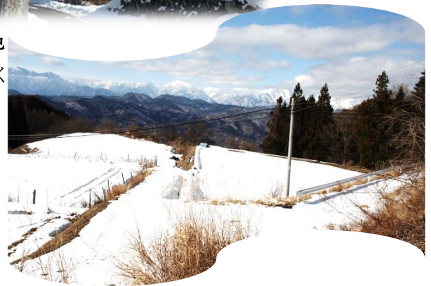
12:35 アルプス見える絶景場所で写しましょう