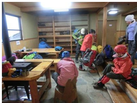
ほかの皆さん出発準備 OK