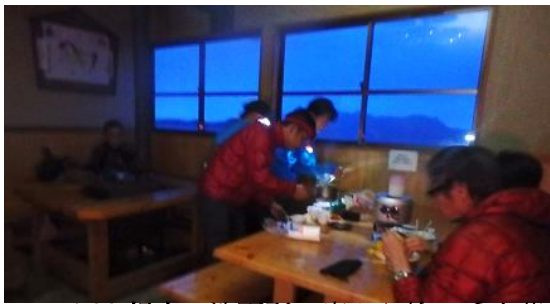
4:30 起床、洗面所の窓から槍ヶ岳山荘の明かりが